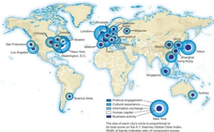
Figure 10.D Top 25 cities in the global cities index 2010