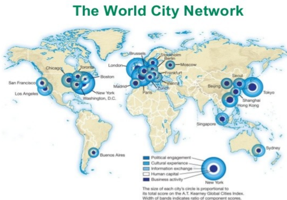
Figure 10.D Top 25 cities in the global cities index 2010

En conclusión, nos encontramos ante un mundo de gigantescas áreas metropolitanas, con una enorme centralidad y capacidad de atracción sobre un entorno que se vacía, áreas vinculadas por redes de redes que canalizan todo lo que circula, dinero, mercancías, personas, todas ellas atraídas por las nuevas oportunidades vitales que estas brindan.